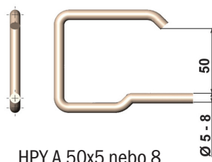
HPY A 50x5 nebo 8